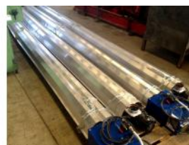
Referencia: LIC-007 SISTEMA DE CALEFACCION A GAS M... Año: 2006 Marca: CARLIEUKLIMA