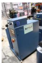
Referencia: BPS-093 FUNDIDOR A GRANEL Año: 2000 Marca: NORDSON