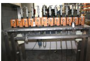
Referencia: BPS-066 GRUPO DE BOMBAS Año: . Marca: PROMINENT