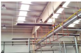
Referencia: MOL-066 CALEFACCION A GAS POR TUBO RADIANTE Año: . Marca: .