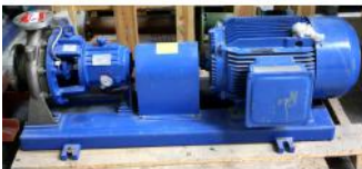
Referencia: BPS-070 BOMBA Año: . Marca: ITUR