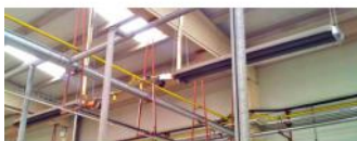
Referencia: MOL-068 CALEFACCION A GAS POR TUBO RADIANTE Año: . Marca: .