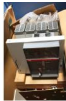
Referencia: BPS-078 INTERRUPTOR Año: . Marca: ABB