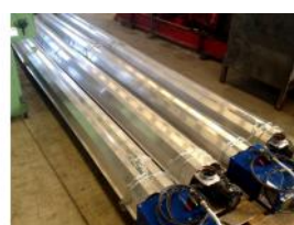
Referencia: LIC-009 SISTEMA DE CALEFACCION A GAS M... Año: 2006 Marca: CARLIEUKLIMA