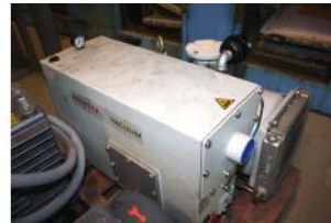
Referencia: BPS-037 BOMBA DE VACIO Año: 1999 Marca: PFEIFFER