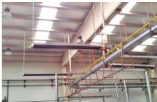
Referencia: MOL-066 CALEFACCION A GAS POR TUBO RADIANTE Año: . Marca: .