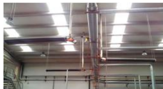
Referencia: MOL-071 CALEFACCION A GAS POR TUBO RADIANTE Año: . Marca: .