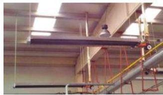
Referencia: MOL-067 CALEFACCION A GAS POR TUBO RADIANTE Año: . Marca: .