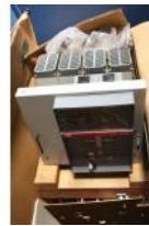
Referencia: BPS-078 INTERRUPTOR Año: . Marca: ABB