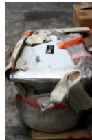
Referencia: BPS-075 TRANSFORMADOR Año: . Marca: SBA-TRAFOTECH