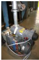
Referencia: BPS-033 BOMBA DE SUCCIÓN Año: . Marca: ROC EDWARDS