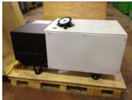
Referencia: BPS-027 BOMBA DE VACIO Año: 2005 Marca: OERLIKON