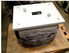
Referencia: BPS-074 TRANSFORMADOR Año: . Marca: SBA-TRAFOTECH