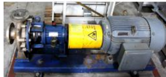
Referencia: BPS-071 BOMBA Año: . Marca: ITUR