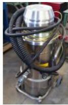
Referencia: BPS-022 ASPIRADOR NEUMATICO ATEX Año: 2008 Marca: NILFISK