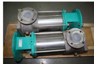
Referencia: BPS-029 BOMBA DE AGUA Año: . Marca: WILO