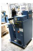
Referencia: BPS-095 FUNDIDOR A GRANEL Año: 2002 Marca: NORDSON