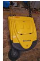
Referencia: MOL-017 BARREDORA ELECTRICA A BATERIA Año: 2005 Marca: KRÜGER