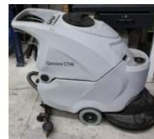
Referencia: BPS-064 FREGADORA - ASPIRADORA Año: . Marca: GANSOW