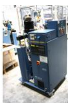
Referencia: BPS-095 FUNDIDOR A GRANEL Año: 2002 Marca: NORDSON