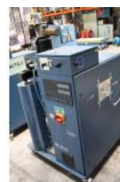
Referencia: BPS-094 FUNDIDOR A GRANEL Año: 2001 Marca: NORDSON