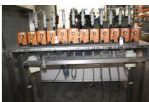
Referencia: BPS-066 GRUPO DE BOMBAS Año: . Marca: PROMINENT