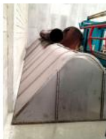
Referencia: COT-001 CAMPANA EXTRACTORA DE HUMOS Año: . Marca: .