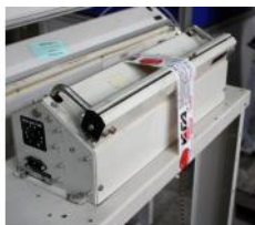
Referencia: BPS-069 ENVASADORA Año: . Marca: AUDION ELEKTRO