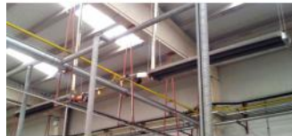
Referencia: MOL-069 CALEFACCION A GAS POR TUBO RADIANTE Año: . Marca: .