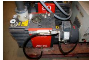
Referencia: BPS-034 BOMBA DE SUCCIÓN Año: . Marca: ROC EDWARDS