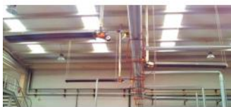
Referencia: MOL-070 CALEFACCION A GAS POR TUBO RADIANTE Año: . Marca: .