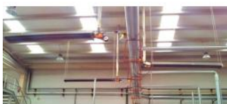
Referencia: MOL-070 CALEFACCION A GAS POR TUBO RADIANTE Año: . Marca: .