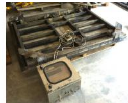
Referencia: LUI-009A BASCULA DE PLATAFORMA Año: . Marca: .