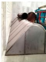
Referencia: COT-001 CAMPANA EXTRACTORA DE HUMOS Año: . Marca: .