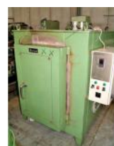
Referencia: MOL-026 HORNO Año: . Marca: BERTAM