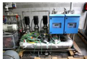
Referencia: BPS-025 GRUPO DE 3 BOMBAS CON 2 GRUPOS... Año: CRN 10-05 A-FGS-G-E-HQQE Marca: GRUNDFOS