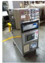
Referencia: BPS-038 SISTEMA DE CONTROL DE HUMOS Año: . Marca: UHP-ATC