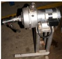
Referencia: FSV-147 BOMBA DE CIRCULACION DE AGUA Año: . Marca: .