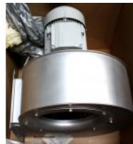
Referencia: BPS-077 VENTILADOR Año: 2003 Marca: SODECA