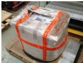
Referencia: BPS-076 TRANSFORMADOR Año: . Marca: SBA-TRAFOTECH