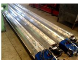
Referencia: LIC-008 SISTEMA DE CALEFACCION A GAS M... Año: 2006 Marca: CARLIEUKLIMA