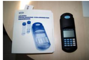
Referencia: FSV-100 COLORIMETRO DIGITAL Año: . Marca: HACH