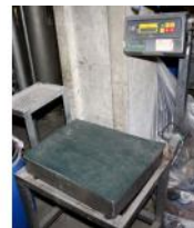
Referencia: TIP-165 BASCULA Año: . Marca: PIBERNAT