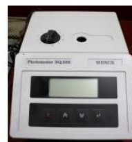
Referencia: TIP-190 FOTOMETRO Año: . Marca: MERCH