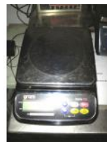
Referencia: EST-029 BASCULA Año: . Marca: GRAM