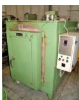
Referencia: MOL-026 HORNO Año: . Marca: BERTAM