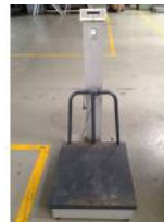
Referencia: LUI-151 BASCULA Año: . Marca: .