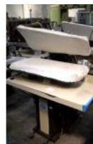
Referencia: CUM-031 PLANCHA INDUSTRIAL Año: . Marca: PANTEX