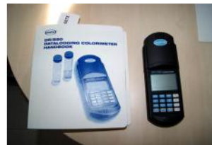
Referencia: FSV-100 COLORIMETRO DIGITAL Año: . Marca: HACH