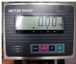
Referencia: TIP-164 BASCULA Año: . Marca: METTLER TOLEDO