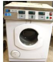
Referencia: TIP-199 SECADORA DE LABORATORIO Año: . Marca: JAMES HEAL