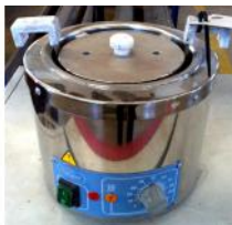
Referencia: BPS-047 BAÑO TERMOSTÁTICO Año: . Marca: RAYPA