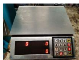
Referencia: EST-048 BASCULA Año: . Marca: .