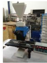
Referencia: BPS-092 MICROSCOPIO Año: . Marca: .