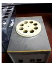
Referencia: TIP-174 THERMOREAKTOR Año: . Marca: .