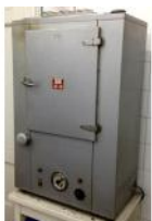
Referencia: LUI-132 ESTUFA Año: . Marca: CEAL