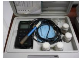
Referencia: TIP-192 PH-METRO PORTATIL Año: . Marca: WTW