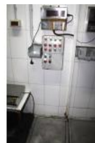
Referencia: EST-031 BASCULA Año: . Marca: MOBBA