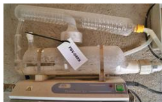
Referencia: FSV-110 DESTILADOR DE AGUA Año: . Marca: JP SELECTA