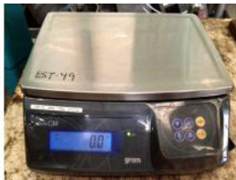
Referencia: EST-049 BASCULA Año: . Marca: GRAM