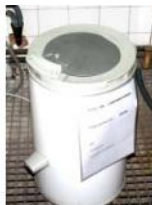
Referencia: ESC-050 CENTRIFUGA DE LABORATORIO Año: . Marca: AEG