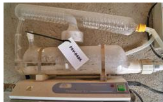
Referencia: FSV-110 DESTILADOR DE AGUA Año: . Marca: JP SELECTA