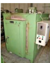
Referencia: MOL-026 HORNO Año: . Marca: BERTAM