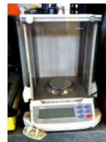
Referencia: BPS-060 BÁSCULA DE LABORATORIO Año: . Marca: AND