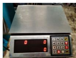
Referencia: EST-048 BASCULA Año: . Marca: .