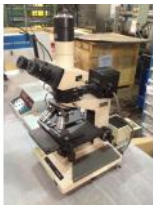
Referencia: BPS-091 MICROSCOPIO Año: . Marca: .