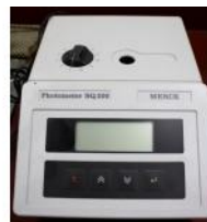
Referencia: TIP-190 FOTOMETRO Año: . Marca: MERCH