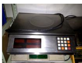
Referencia: EST-032 BASCULA Año: . Marca: MOBBA