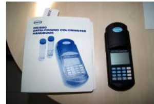
Referencia: FSV-100 COLORIMETRO DIGITAL Año: . Marca: HACH