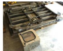
Referencia: LUI-009A BASCULA DE PLATAFORMA Año: . Marca: .