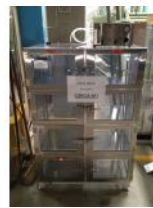
Referencia: BPS-097 CAMARA DESHUMIDIFICADORA Año: . Marca: TERRA UNIVERSAL