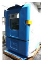
Referencia: BPS-024 CÁMARA CLIMÁTICA Año: 2006 Marca: ANGELATONI