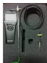
Referencia: BPS-142 MICROMANOMETRO Año: . Marca: AIRFLOW