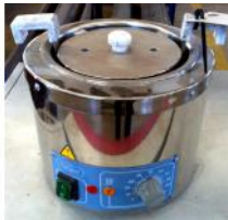
Referencia: BPS-045 BAÑO TERMOSTÁTICO Año: . Marca: RAYPA