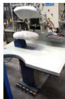
Referencia: CUM-022 PLANCHA INDUSTRIAL Año: . Marca: ARBO