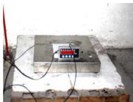
Referencia: ESC-055 BASCULA Año: 2006 Marca: EUROPESAJE