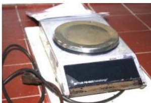
Referencia: ESC-054 BASCULA DE LABORATORIO Año: . Marca: METTLER TOLEDO