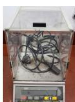
Referencia: TIP-191 BASCULA DE PRECISION Año: . Marca: COBOS