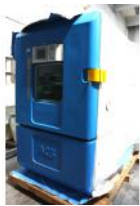
Referencia: BPS-024 CÁMARA CLIMÁTICA Año: 2006 Marca: ANGELATONI