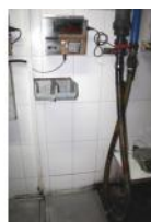
Referencia: EST-030 BASCULA Año: . Marca: MOBBA