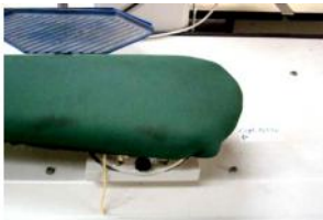
Referencia: CUM-034 PLANCHA INDUSTRIAL Año: 1998 Marca: PRIMULA