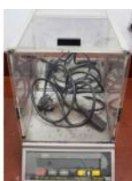
Referencia: TIP-191 BASCULA DE PRECISION Año: . Marca: COBOS