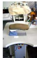
Referencia: CUM-020 PLANCHA INDUSTRIAL Año: . Marca: ARBO