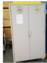
Referencia: BPS-096 ARMARIO PARA PRODUCTOS QUÍMICOS Año: 2006 Marca: GS