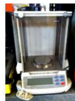
Referencia: BPS-060 BÁSCULA DE LABORATORIO Año: . Marca: AND