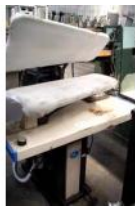
Referencia: CUM-024 PLANCHA INDUSTRIAL Año: . Marca: PANTEX