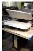
Referencia: CUM-031 PLANCHA INDUSTRIAL Año: . Marca: PANTEX