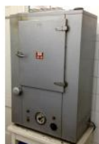
Referencia: LUI-132 ESTUFA Año: . Marca: CEAL