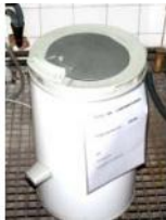
Referencia: ESC-050 CENTRIFUGA DE LABORATORIO Año: . Marca: AEG