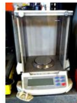
Referencia: BPS-060 BÁSCULA DE LABORATORIO Año: . Marca: AND