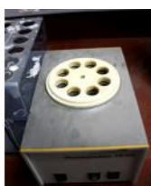
Referencia: TIP-174 THERMOREAKTOR Año: . Marca: .