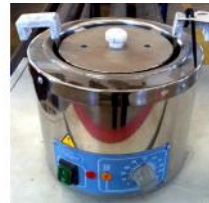
Referencia: BPS-046 BAÑO TERMOSTÁTICO Año: . Marca: RAYPA