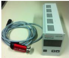
Referencia: BPS-135 PFEIFFER VACUUM Año: . Marca: PFEIFFER