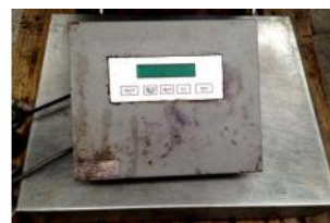
Referencia: LUI-159 BASCULA DE PLATAFORMA Año: . Marca: .