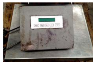
Referencia: LUI-159 BASCULA DE PLATAFORMA Año: . Marca: .