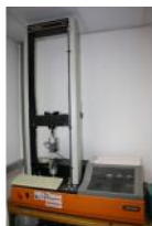
Referencia: TIP-116 DINAMOMETRO- TENSIOMETRO Año: . Marca: INSTRON