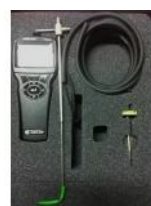
Referencia: BPS-142 MICROMANOMETRO Año: . Marca: AIRFLOW