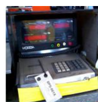
Referencia: BPS-061 BÁSCULA DIGITAL Año: . Marca: MOBBA