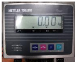
Referencia: TIP-164 BASCULA Año: . Marca: METTLER TOLEDO