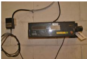
Referencia: FSV-108 BASCULA Año: . Marca: PRECIA