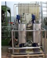
Referencia: TIG-008 DEPOSITOS DE ACERO INOXIDABLE ... Año: . Marca: .