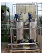
Referencia: TIG-008 DEPOSITOS DE ACERO INOXIDABLE ... Año: . Marca: .