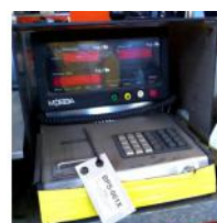
Referencia: BPS-061 BÁSCULA DIGITAL Año: . Marca: MOBBA