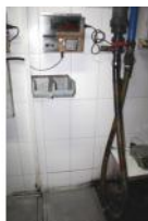
Referencia: EST-030 BASCULA Año: . Marca: MOBBA