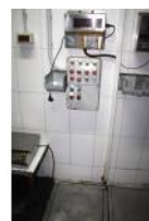
Referencia: EST-031 BASCULA Año: . Marca: MOBBA