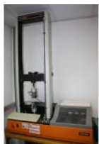
Referencia: TIP-116 DINAMOMETRO- TENSIONMETRO Año: . Marca: INSTRON