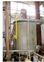
Referencia: LAN-950 CALDERA DE ACEITE TERMICO Año: 1984 Marca: SUGIMAT