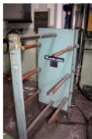
Referencia: LUI-024 INTERCAMBIADOR DE CALOR Año: 1981 Marca: ALFA-LAVAL