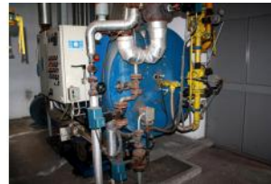
Referencia: LUI-052 CALDERA DE VAPOR Año: 1998 Marca: BABCOCK WANSON