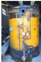
Referencia: M-1382 CALDERA DE ACEITE TERMICO Año: . Marca: NOXMAN