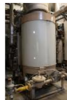
Referencia: TIP-118 CALDERA DE VAPOR Año: 1990 Marca: CLAYTON