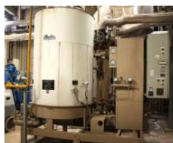
Referencia: TIP-119 CALDERA DE VAPOR Año: 1994 Marca: CLAYTON