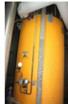
Referencia: TIP-078 CALDERA DE ACEITE TERMICO Año: 1998 Marca: NOXMAN