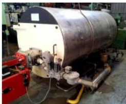
Referencia: M-1477 CALDERA DE VAPOR Año: 2001 Marca: SOGECAL