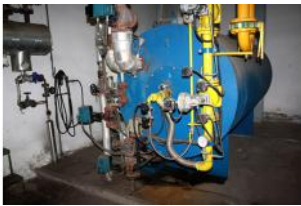
Referencia: LUI-049 CALDERA DE VAPOR Año: 2000 Marca: BABCOCK WANSON