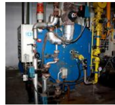
Referencia: LUI-050 CALDERA DE VAPOR Año: 1998 Marca: BABCOCK WANSON