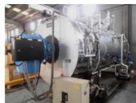
Referencia: TIG-001 CALDERA DE VAPOR PIROTUBULAR H... Año: 2001 Marca: STEAMBLOC