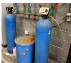
Referencia: TIP-185 DESCALCIFICADOR Año: . Marca: .