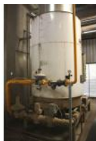
Referencia: TIP-117 CALDERA DE VAPOR Año: 1989 Marca: CLAYTON