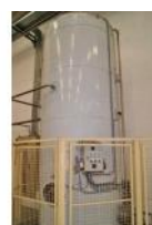
Referencia: FSV-112 INTERACUMULADOR DE AGUA CALIENTE Año: . Marca: TECNIVAP