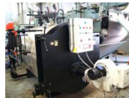
Referencia: TPS-022 CALDERA DE VAPOR Año: 2001 Marca: VYC INDUSTRIAL