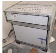
Referencia: LIC-010 GENERADOR DE AIRE CON FILTRO D... Año: 2006 Marca: FINITURE