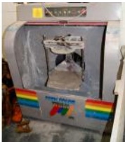
Referencia: LIC-002 MEZCLADOR DE BOTES Año: 2001 Marca: ITALTINTO