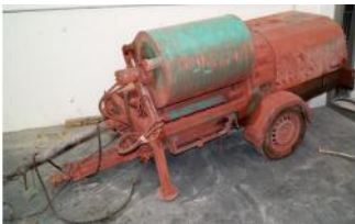
Referencia: LIC-001 ENFOSCADORA Año: 2008 Marca: IMER