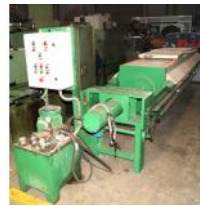
Referencia: ESC-079 FILTRO PRENSA Año: . Marca: .