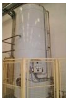
Referencia: FSV-112 INTERACUMULADOR DE AGUA CALIENTE Año: . Marca: TECNIVAP