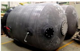
Referencia: BPS-003A DEPOSITO DE FIBRA POLIESTER Año: . Marca: .