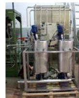
Referencia: TIG-008 DEPOSITOS DE ACERO INOXIDABLE ... Año: . Marca: .