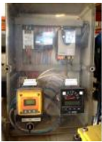
Referencia: RT-007 CONTROL PH DEPURADORA Año: 2007 Marca: MILTON ROY