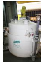
Referencia: BPS-098 DEPOSITO Año: . Marca: ECOTEC