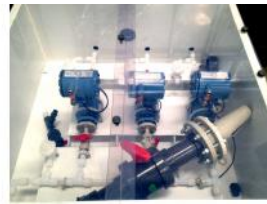
Referencia: BPS-083 CONTADORES Año: 2009 Marca: ROSEMOUNT