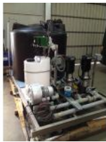
Referencia: BPS-073 CONJUNTO CON DEPÓSITO DE PLÁ... Año: . Marca: GRUNDFOS