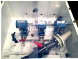
Referencia: BPS-083 CONTADORES Año: 2009 Marca: ROSEMOUNT