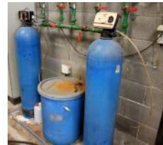
Referencia: TIP-185 DESCALCIFICADOR Año: . Marca: .