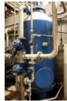
Referencia: TIP-127 DESCALCIFICADOR Año: . Marca: MANITOWOC