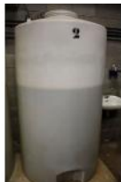
Referencia: TIP-126 DESCALCIFICADOR Año: . Marca: MANITOWOC