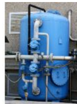
Referencia: TIP-131 FILTRO CARBON ACTIVADO Año: . Marca: .