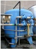
Referencia: TIP-130 FILTRO SILEX Año: . Marca: .