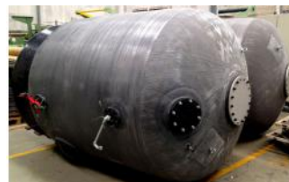
Referencia: BPS-003B DEPOSITO DE FIBRA POLIESTER Año: . Marca: .