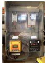
Referencia: RT-007 CONTROL PH DEPURADORA Año: 2007 Marca: MILTON ROY