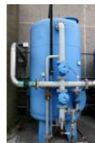
Referencia: TIP-133 FILTRO CARBON ACTIVADO Año: . Marca: .