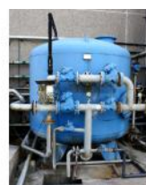
Referencia: TIP-129 FILTRO SILEX Año: . Marca: .