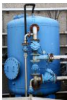
Referencia: TIP-132 FILTRO CARBON ACTIVADO Año: . Marca: .