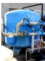
Referencia: TIP-128 FILTRO SILEX Año: . Marca: .