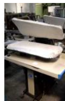
Referencia: CUM-031 PLANCHA INDUSTRIAL Año: . Marca: PANTEX