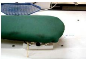
Referencia: CUM-034 PLANCHA INDUSTRIAL Año: 1998 Marca: PRIMULA