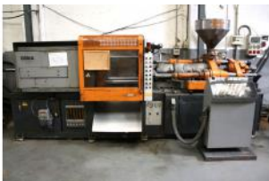
Referencia: INLV-007 INYECTORA DE PLASTICO Año: 1989 Marca: OIMA