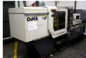
Referencia: INLV-006 INYECTORA DE PLASTICO Año: 1998 Marca: OIMA