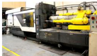
Referencia: INLV-009 INYECTORA DE PLASTICO Año: 1992 Marca: OIMA