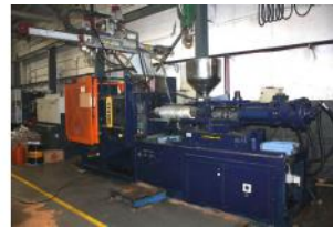
Referencia: INLV-003 INYECTORA DE PLASTICO Año: 1989 Marca: METALMECCANICA