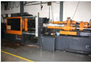
Referencia: INLV-002 INYECTORA DE PLASTICO Año: 1988 Marca: OIMA