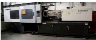
Referencia: INLV-004 INYECTORA DE PLASTICO Año: 2006 Marca: CHEN DE