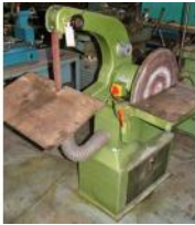
Referencia: MOL-029 PULIDORA DE CINTA Y DISCO Año: . Marca: .