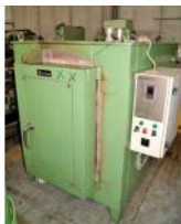
Referencia: MOL-026 HORNO Año: . Marca: BERTAM