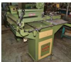
Referencia: MOL-064 PANTOGRAFO Año: . Marca: LINCE