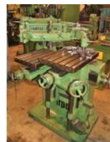
Referencia: MOL-047 PANTOGRAFO Año: . Marca: PARPAS