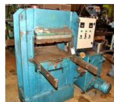
Referencia: MOL-005 PRENSA DE VULCANIZADO Año: . Marca: .