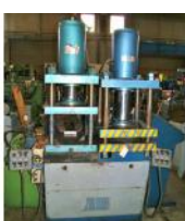
Referencia: MOL-004 PRENSA INYECTORA DE CAUCHO VUL... Año: . Marca: VILOR