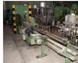
Referencia: ALF-014 ENDEREZADORA Y CORTADORA DE VA... Año: . Marca: BUCH