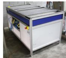
Referencia: BPS-067 MESA DE MONTAJE CON COJÍN DE AIRE Año: 2007 Marca: ELA SISTEMA