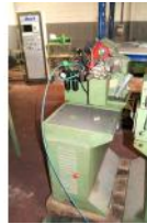
Referencia: ALF-002 RANURADORA SEMIAUTOMATICA Año: 1991 Marca: ETXEBARRI