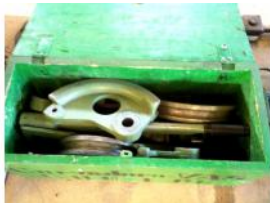
Referencia: BPS-039 CURVADORA DE TUBOS MANUAL Año: . Marca: VAS