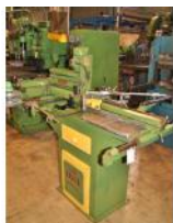
Referencia: MOL-015 PANTOGRAFO Año: . Marca: LINCE