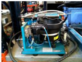
Referencia: BPS-062 ALIMENTADOR VIBRADOR CON ATORN... Año: . Marca: WEBER